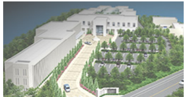
〈LEDを導入する「キアラリゾート&スパ」〉

また、浜名湖浄化プロジェクトに全面協力し、地球環境保護の取り組みを行う一方、エネルギー消費量が多い従来型の施設から、省エネルギー施設を開発する事で経済性にすぐれ、かつ、環境に配慮したリゾート施設を開発する予定です。これら次世代型リゾート施設として本年一部完成、2012年グランドオープンするのが「キアラリゾート&スパ浜名湖」です。